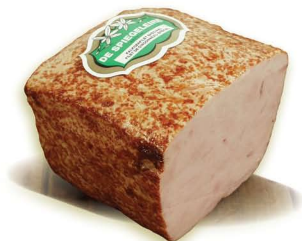
(201) Filet de dindonneau spécial

Code d'emballage (250) Poids par pièce: 1,500 Kg (4 p. / carton)