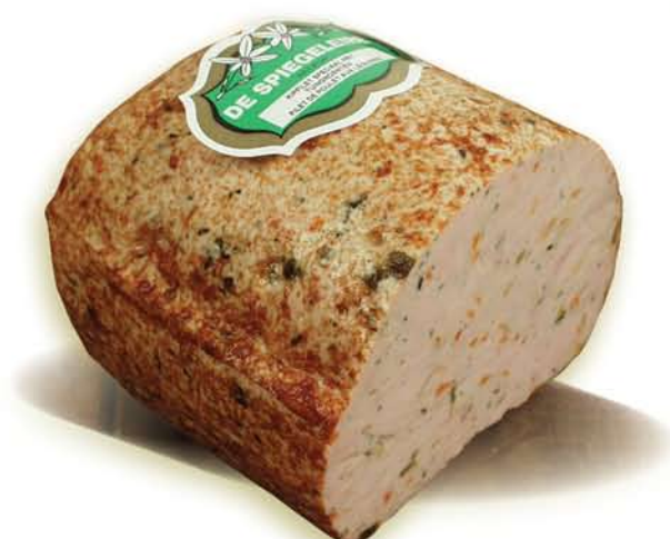
(203) Filet de poulet aux légumes

La viande de poitrine de poulet ou de dindonneau désossée est marinée au préalable. Ces filets sont alors pressés dans un moule et cuits au four. Juste avant d'être emballés, ils sont délicieusement mordorés. Cette opération confère au filet de poulet une saveur succulente et une croûte brune très caractéristique qui n'appartient qu'au poulet.