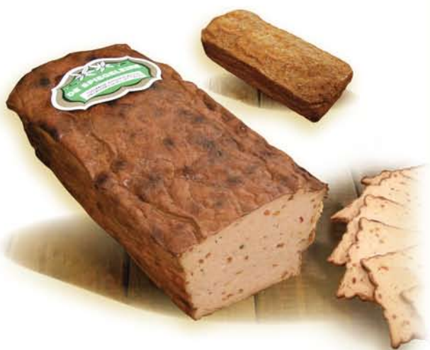
(253) Fricandeau de Poulet Toscan

Le poivre 'Peppadew' ressemble à un croisement entre un mini-piment rouge et une tomate cerise. Grâce à lui, le fricandon possède une saveur unique, d'abord sucrée et puis ... piquante.