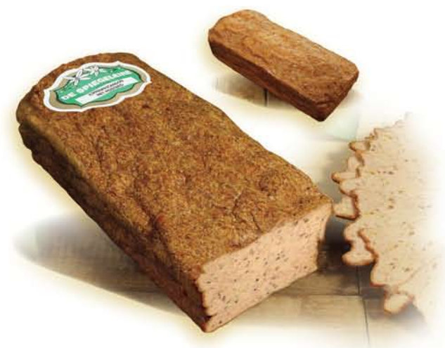
(254) Fricandon de poulet à la moutarde

En ajoutant des tomates séchées au soleil et du pesto rouge, ce fricandeau de poulet obtient un goût méditerranéen.