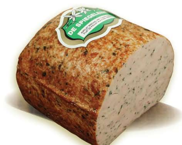
(204) Filet de poulet aux fines herbes

Des délicieux jeunes légumes frais du jardin (tels que carottes, poireaux, chou vert, ...) sont ajoutés pendant la préparation.