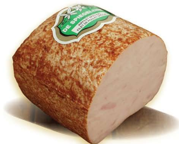
(200) Filet de poulet spécial

Pour nos filets de poulet, il faut compter un cycle de commande de 3 jours minimum