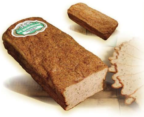
(251) Fricandeau de Poulet aux fines herbes

Code d'emballage (264) Poids par pièce: 1,700 Kg (1 p. / carton)