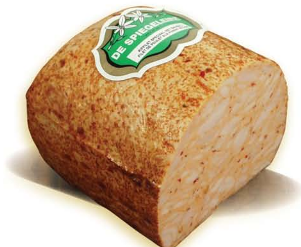
(224) Filet de poulet aux piment rouge

L'ajout de curry, fabriqué à base d'un mélange d'épices asiatiques, e.a. le coriandre, le poivre, le cumin, le poivre de Cayenne, confère une saveur aromatique et corsée.