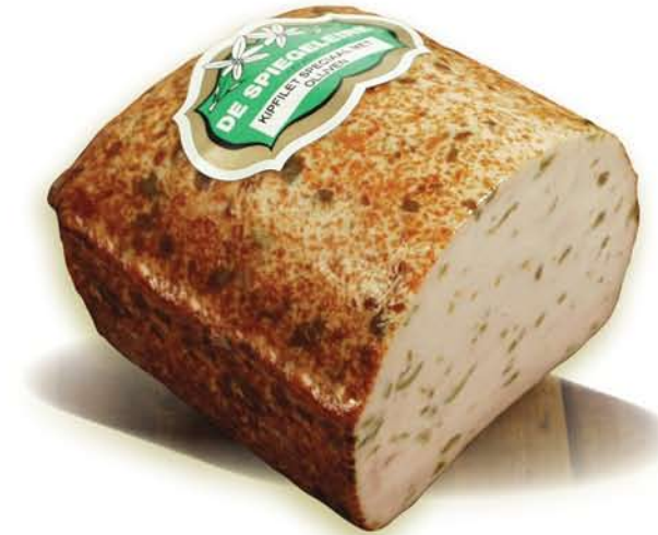
(227) Filet de poulet aux olives

En y ajoutant des tomates séchées au soleil, ce filet de poulet obtient un goût du sud.