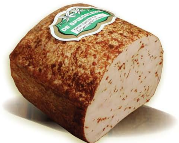
(226) Filet de poulet aux tomates séchées au soleil

L'ajout de sambal confère à ce filet de poulet un caractère très corsé.