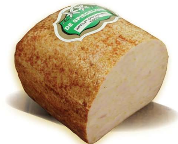
(221) Filet de poulet au curry

La quantité minimale à commander est 75 Kg