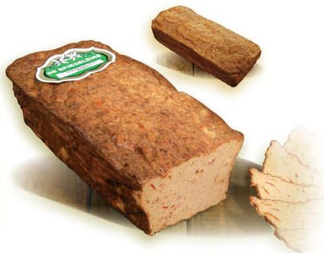
(252) Fricandeau de Poulet au Peppadew

En ajoutant des 'fines herbes', la saveur de ce fricandon devient particulière et plus aromatisée. Un dérivé réussi d'un produit très en vogue.