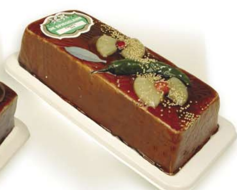
(119 026) Pineapple Pâté (fine)