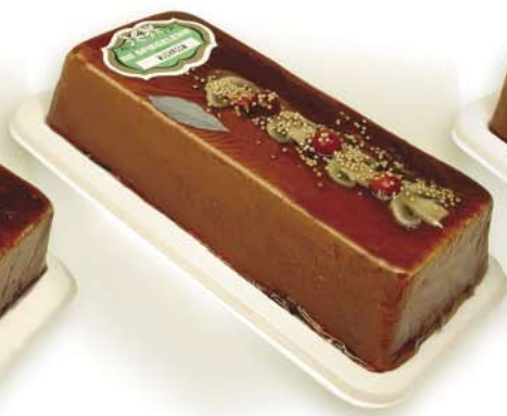
(101 026) Mushroom Pâté (fine)