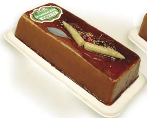
(100 026) Brussels Pâté (fine)

(026) Loaf skin in cardboard box - 2,000 kg