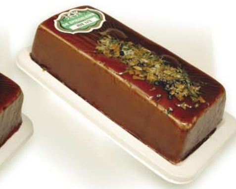
(114 026) Herb Pâté (fine)