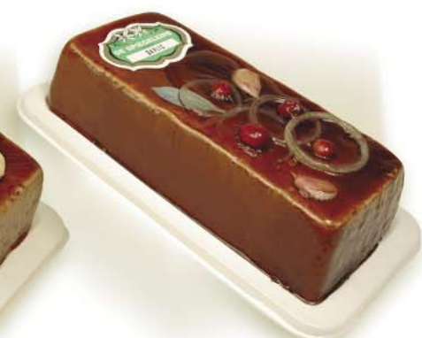
(111 026) Garlic Pâté (coarse)