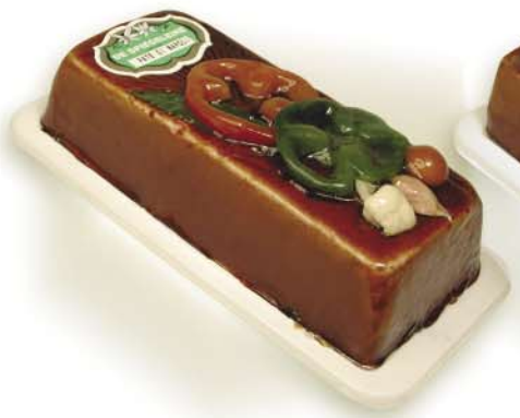
(152 026) Di Napoli Pâté (coarse)