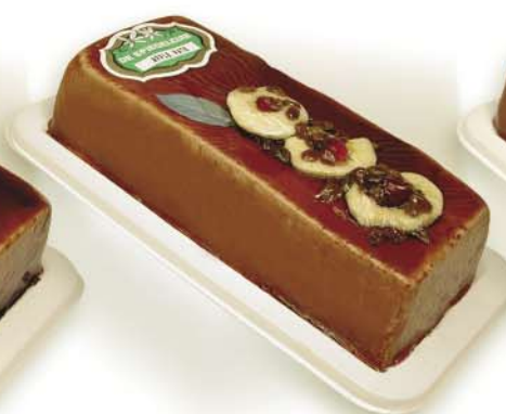
(104 026) Apple Pâté (coarse)