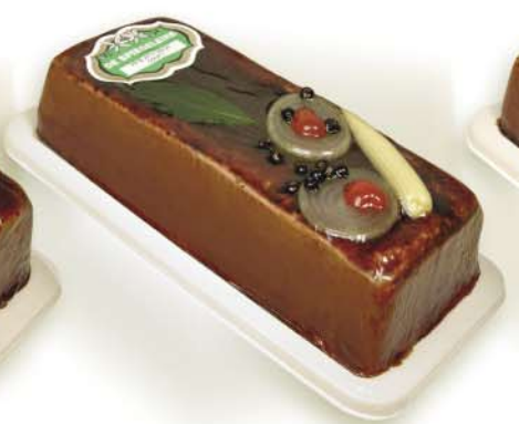
(327 026) Pâté with onion confit (coarse)