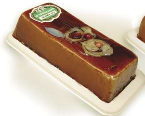
(103 026) Ardennes Pâté (coarse)