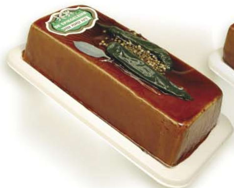
(112 026) Green Pepper Pâté (coarse)