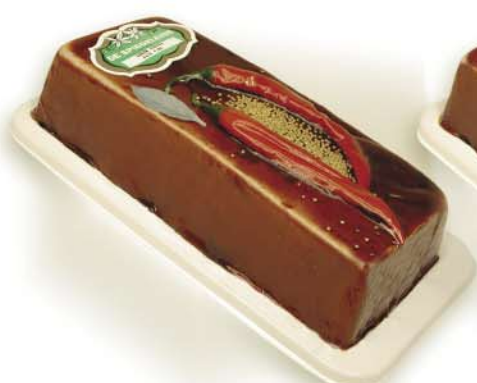
(121 026) Green Pepper Pâté (fine)