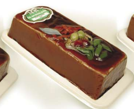
(122 026) Olive and Pepper Pâté (coarse)