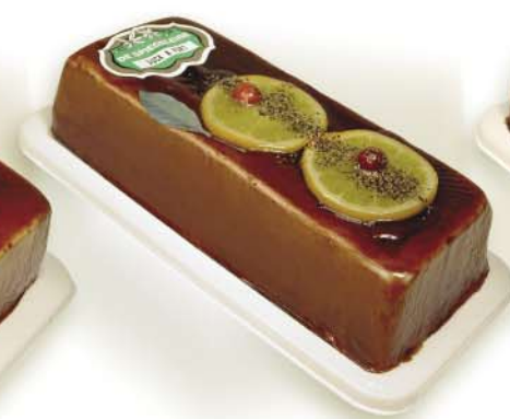
(113 026) Duck Pâté with Port (fine)