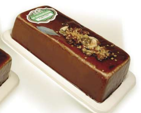
(136 026) 4-Nuts Pâté (coarse)