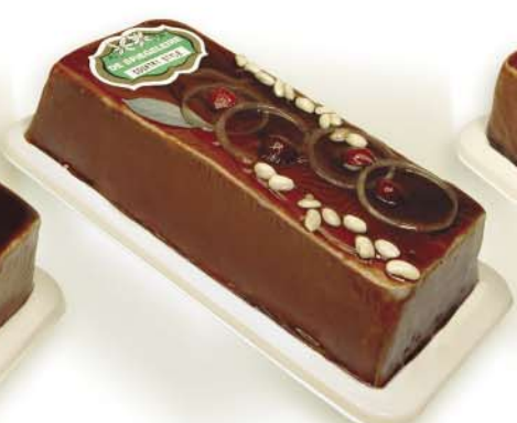
(118 026) Country Style Pâté (coarse)