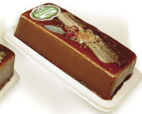
(102 026) Farmers Pâté (coarse)