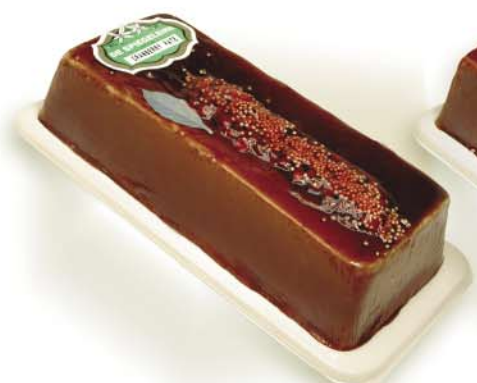
(117 026) Cranberry Pâté (fine)