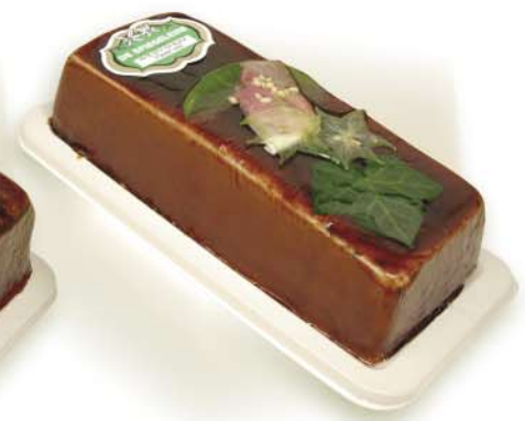
(353 026) Pâté with Black Forest Ham (coarse)